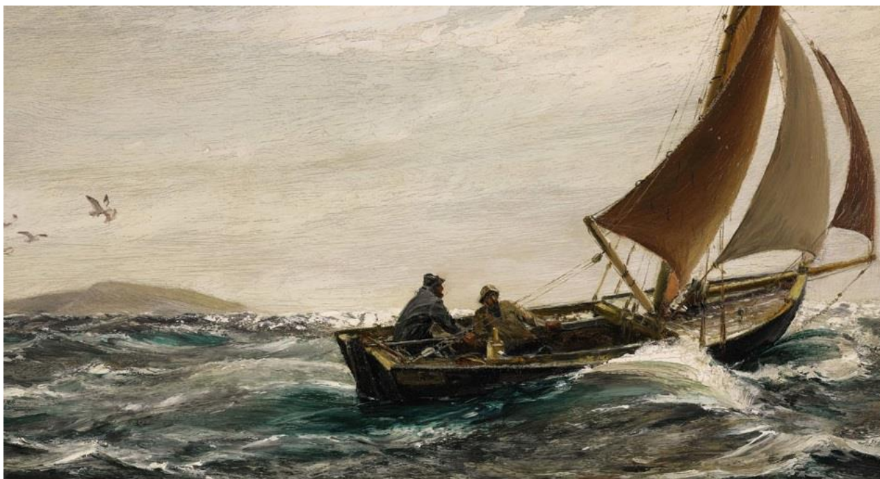
1916, With Wind and Tide – Off The Dodman-Head, Falmouth; Charles Napier Hemy (1841-1917)

De wijde zee vervult mensen met een gevoel van geluk. Met duizenden trekken ze er op uit naar de Noordzee. Maar de bewoners aan zee vertellen sterke verhalen. Mysterieus, waargebeurd of gefantaseerd, met beklijvende ervaringen en diep menselijke emoties. Deze vertelvoorstelling brengt verhalen over polders, strand en kustbewoners in hun strijd om het bestaan.